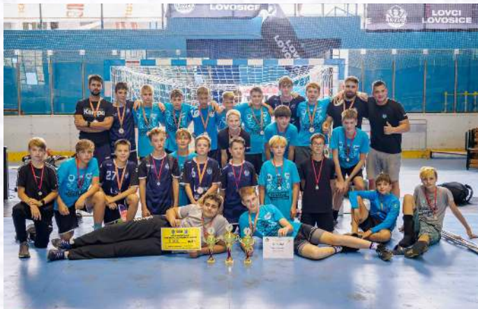
Družstva lovosických minizáků (snímek vlevo) vybojovala třetí a devatenácté místo, bronzoví skončili i starší žáci.